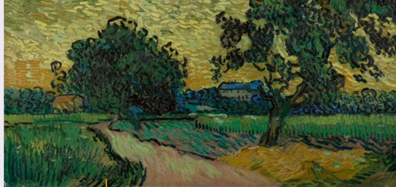
VINCENT VAN GOGH, LANDSCHAP BIJ AVONDSCHMERING, 1890