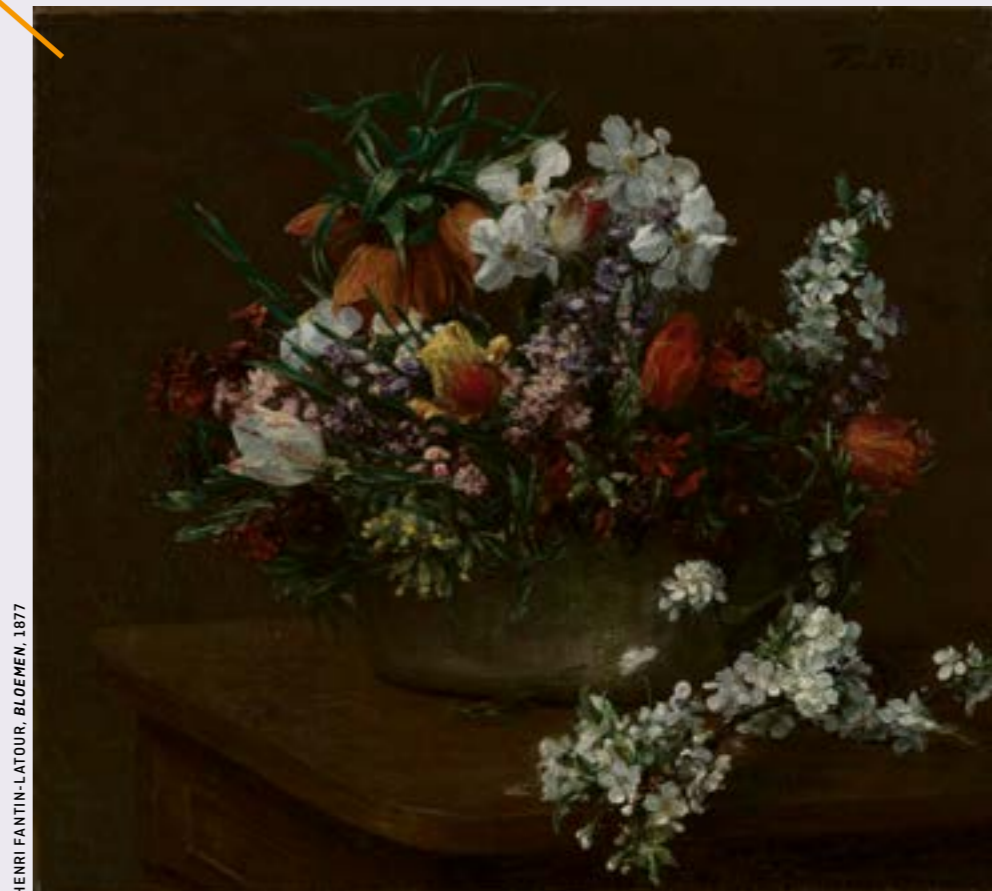
HENRI FANTIN-LATOIR, BLOEMEN, 1877

Vanaf het moment dat Jo als jonge weduwe in Nederland ging wonen, omringde ze zich met de schilderijen van Van Gogh. Eerst in haar woning in Bussum, waar ze tien jaar lang pensionhoudster was, later in haar appartement in Amsterdam. Daar zat ze met haar bezoekers oog in oog met haar favoriete werken. Een deel daarvan wilde ze beslist bijhouden. Die kunstwerken bevinden zich nu in het Van Gogh Museum.